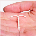
Sistema Intrauterino Ormonale (IUS)

L'efficacia è simile (vicina al 100%), cambiano solo le modalità di utilizzo. Tutti richiedono la prescrizione del medico e hanno effetto contraccettivo anche negli eventuali periodi di pausa, ma nessuno offre protezione contro le Malattie Sessualmente Trasmissibili. Si possono scegliere in base alle proprie caratteristiche ed esigenze.